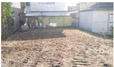
整地、転圧後完了となります