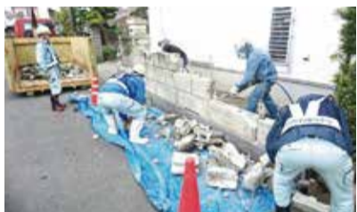
外構、植栽等の撤去