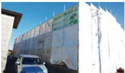
飛散防止・養生の設置

●建物の構造や現場の状況によって多少の前後はありますが、下記のような流れで行います。