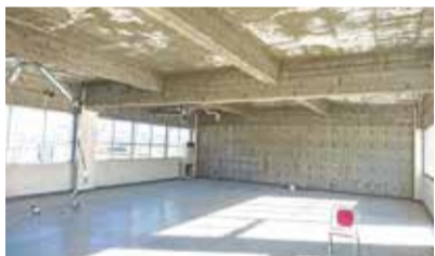
内装材、建具等の撤去