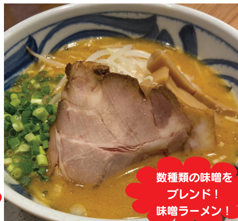
数種類の味噌を ブレンド！ 味噌ラーメン！

今年4月にオープンした「中華そば あずさ」の人気アイテムは、醤油豚骨ラーメン！ 国産豚ガラを長時間煮込んだクリーミーな味わいが特徴です。自家製の中細麺と醤油豚骨の旨味がお口いっぱいに広がります♪ また、魚介豚骨ラーメンは、カツオ節やサバ節等、数種類の魚介系のダシを、自慢の豚骨スープに合わせました。太麺のモチモチ感と濃厚な魚介豚骨スープが奏でるハーモニーが楽しめます。