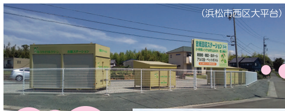
(浜松市西区大平台)