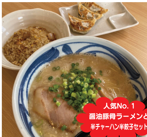
人気No.1 醤油豚骨ラーメンと 半チャーハン半餃子セット