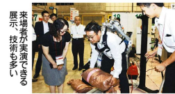
来場者が実演で見る展示技術も多岐にわたる

地域経済の活性化推進を目的に、「浜松から未来を創る!」をテーマに掲げ、浜松市および周辺地域の約250の企業および団体が出展する。その領域は製造業、サービス業、流通業まで幅広く、業種も機械製造、金属加工、商社、運輸・物流、IT関連、教育、建築・建設・不動産、医療・介護、飲食、各種コンサルティングなど多岐にわたる。