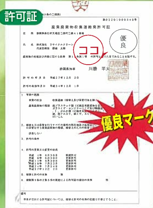
産業廃棄物収集運搬業許可証(静岡県)