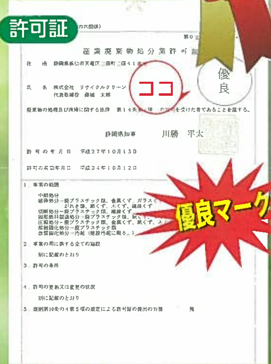
産業廃棄物処分業許可証(静岡県)

リサイクルクリーンは静岡県及び浜松市から 収集運搬業・処分業共に「優良」と認定されました。